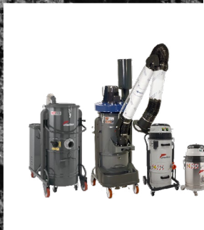
ASPIRATORI PORTATILI PER PULIZIE INDUSTRIALI

Siamo leader nella produzione di macchinari per l'aspirazione industriale: dagli aspiratori portatili per pulizie industriali ai sistemi di aspirazione centralizzata, alle soluzioni personalizzate fino ai sistemi di trasporto pneumatico.