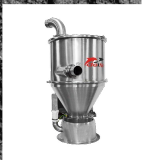
SISTEMI DI TRASPORTO PNEUMATICO