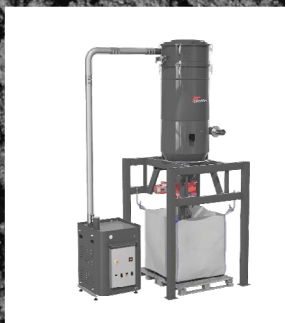
SISTEMI DI ASPIRAZIONE CENTRALIZZATA